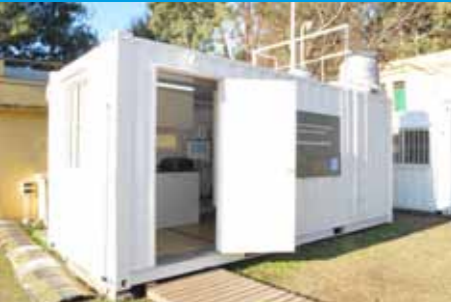
CADA ESTACIÓN INCLUYE

PLC para almacenamiento y transmisión de datos por vía 3G.