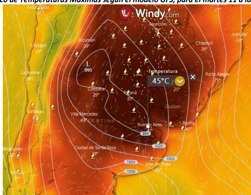
Pronóstico de Temperaturas Máximas según el modelo GFS, para el viernes 14 a las 16:00 Hs